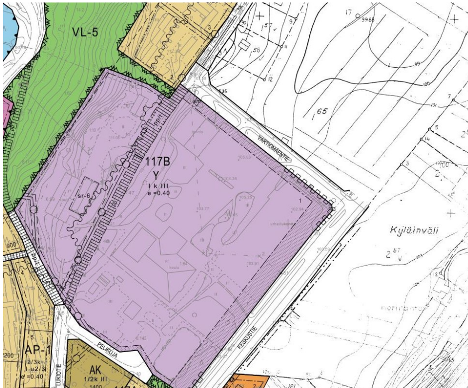
Kuva 5. Ote asemakaavasta, johon nyt laadittava asemakaava rajautuu.

Alueelle ei ole laadittu asemakaavaa. Lännestä alue rajautuu vuonna 2017 laadittuun asemakaavaan, joka käsittää muun muassa Vartiomäentien katualueen sekä yleisten rakennusten korttelialueen (Y).