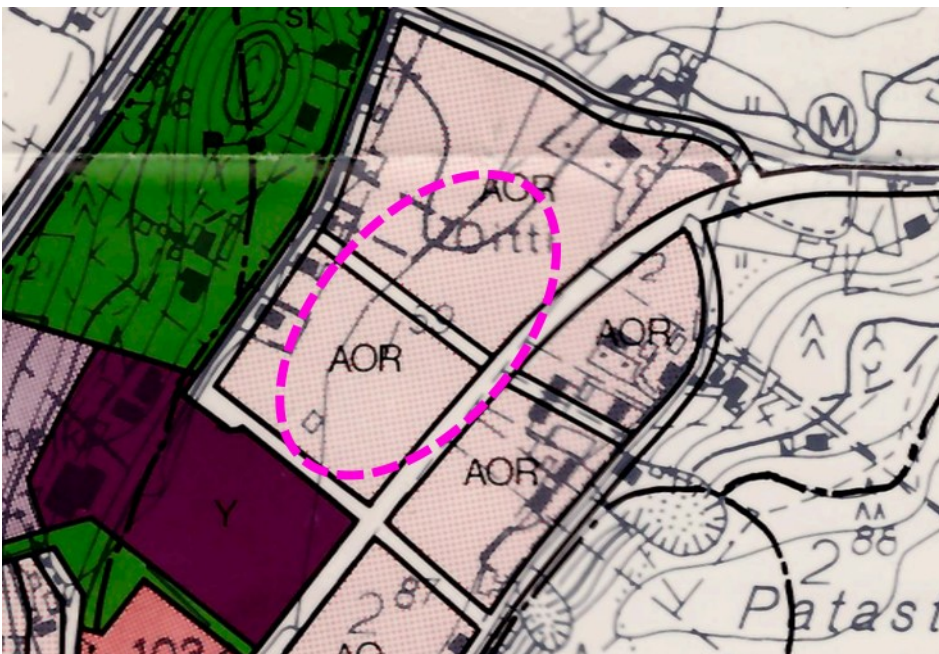
Kuva 4 Ote oikeusvaikutuksettomasta Oitin yleiskaavasta (1979).

Alueelle on laadittu Oitin oikeusvaikutukseton yleiskaava (KValt 25.9.1979), jossa suunnittelualueelle on osoitettu erillisten tai kytkettyjen pientalojen korttelialueita (AOR) sekä tie-, katu ja liikennealueita.