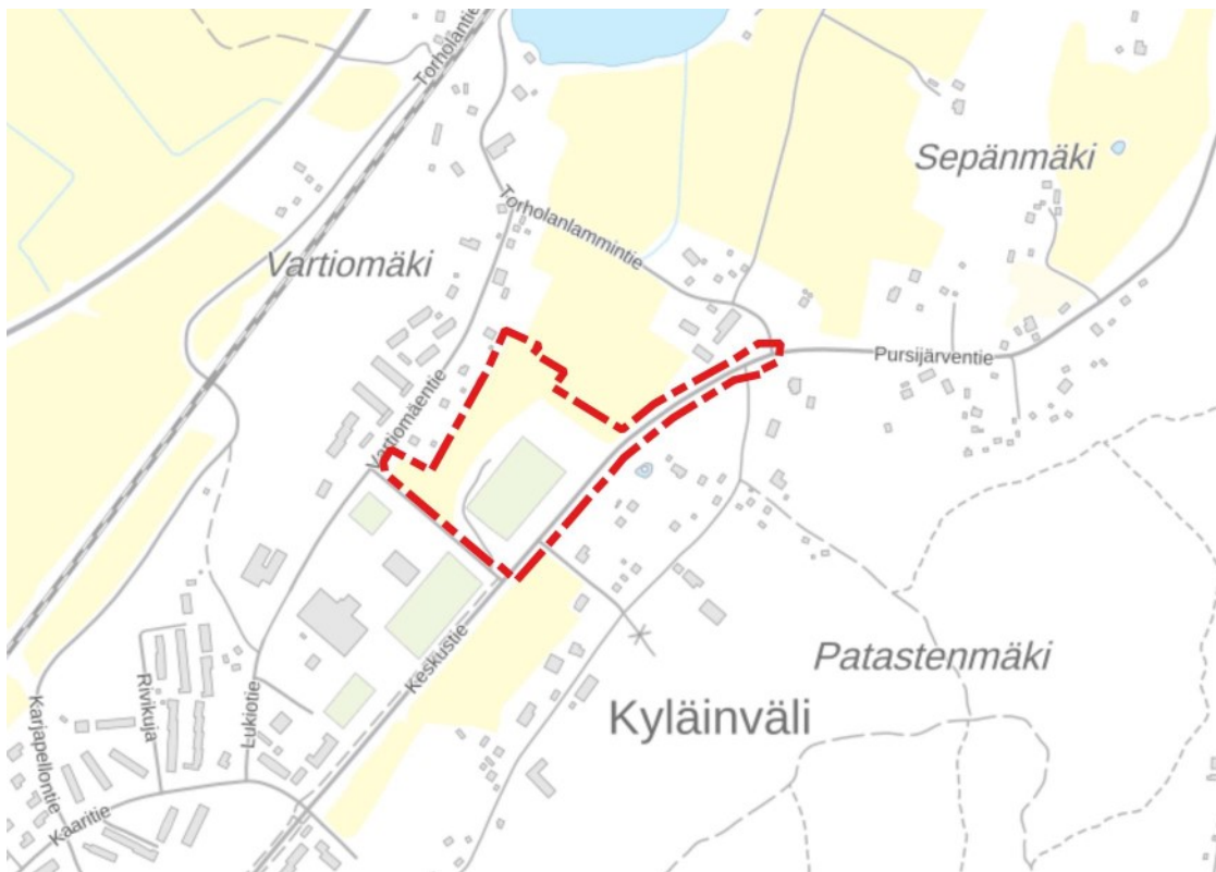
Kuva 1 Suunnittelualueen sijainti Maanmittauslaitoksen taustakartalla.

Vartiomäentien toisella puolella sijaitsee Hausjärven yhtenäiskoulu, yläkoulu ja lukio.